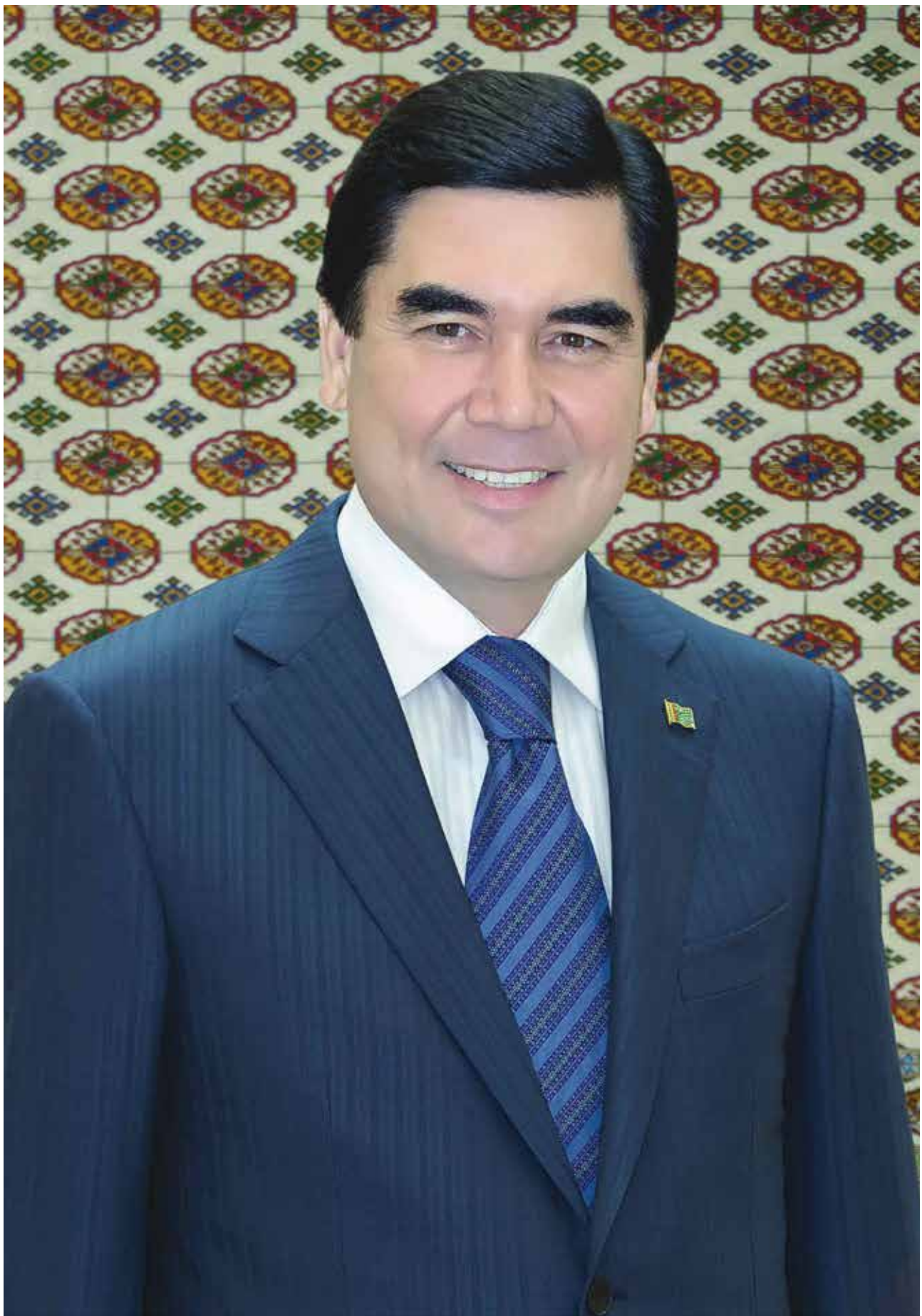
Президент Туркменистана Гурбангулы Бердымухамедов